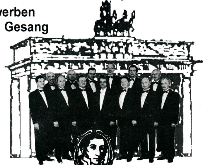
Berliner Carl Maria von Weber Vokalensemble "Wir werben für den Gesang"

Ökumenischer Chor Hörste-Stockkämpen Posaunenchor Hörste-Hesselteich